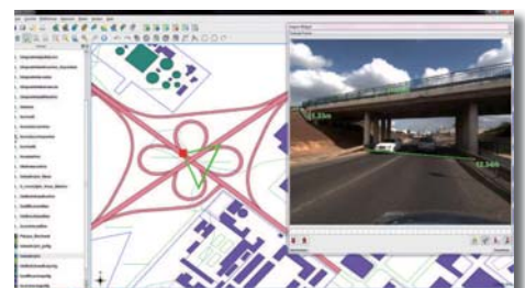
Intégration dans QGIS

Ces solutions permettent de disposer de l'imagerie au sol pour illustrer toute couche d'objets, sans avoir à associer manuellement l'image à l'objet.